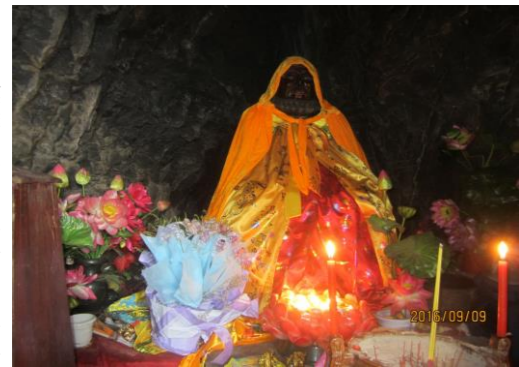
九年間、坐禅をした岩窟に祀られている達磨像。参拝者も多く、窟内には堂守らしき僧が居て、今でも大切にされている。