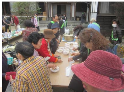
おでんと石垣もちが良く売れました

第二十一回目のチャリティバザーが十一月二十三日、晴天の中開催されました。物が集まるか心配でしたが、会員の皆様のお蔭で沢山集まり、盛大に開催されました。