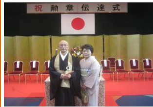
十二月十一日、法務省にて法務大臣より伝達され、午後皇居に参内し、新天皇よりお言葉を賜りました。一同百五十名。

自身のことでは恐縮ですが、昨年秋の叙勲で長年の保護司としての功績が認められ、瑞宝双光章受章の栄に浴しました。十二月十一日、法務省にて法務大臣より伝達され、午後皇居に参内し、新天皇よりお言葉を賜りました。一同百五十名。